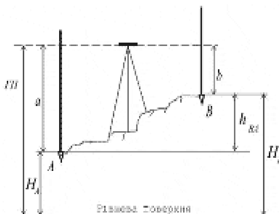
Рисунок 1 - Схема геометрического нивелирования из середины

Существует два способа геометрического нивелирования: нивелирование из середины и нивелирование вперед. В ходе геодезических изысканий был применен способ "нивелирование из середины".