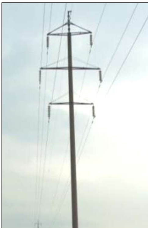
Фото 5. Опора № 14. Отклонение более 400мм.