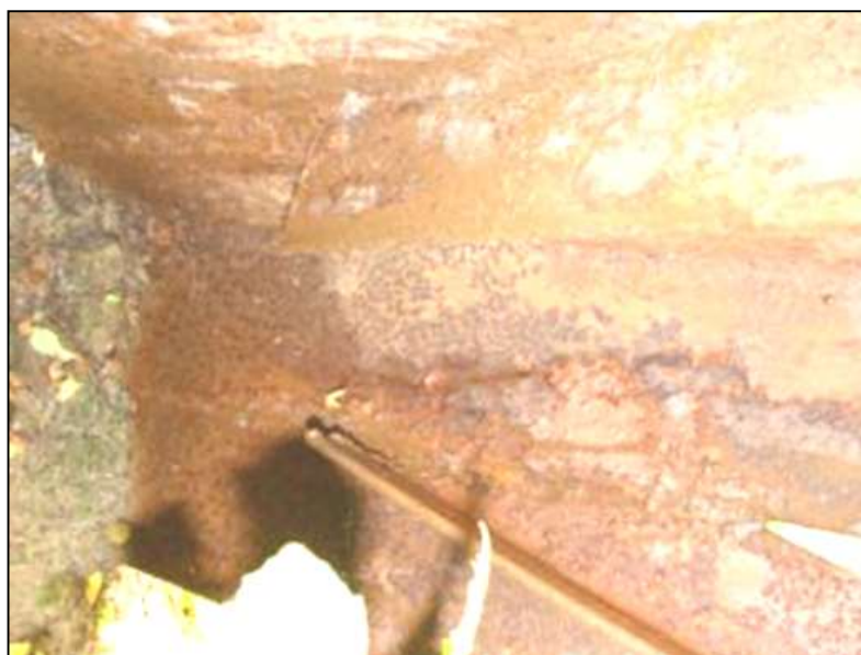
Фото 9. Опора № 8. Коррозия опорных узлов.