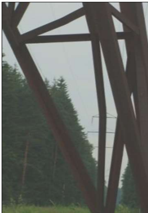
Фото 8. Опора № 18. Деформация раскоса решетки более 20мм.