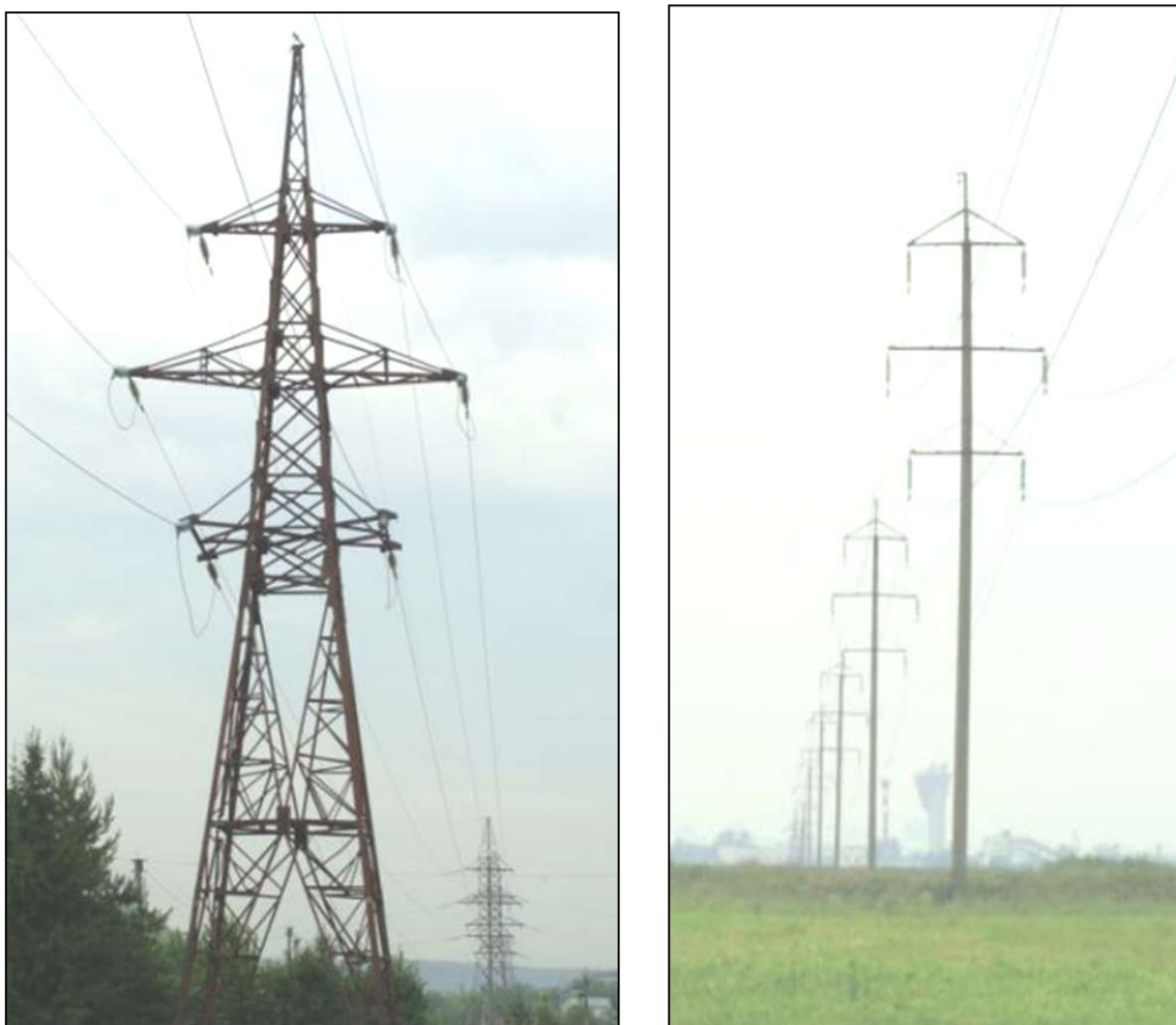
Фото 1, 2.