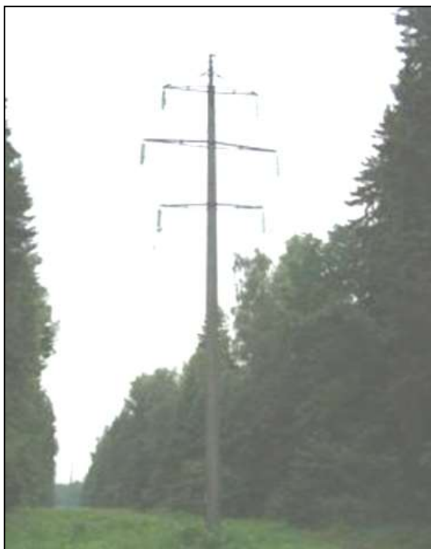
Фото 3. Опора № 20. Отклонение от вертикали более 400мм.