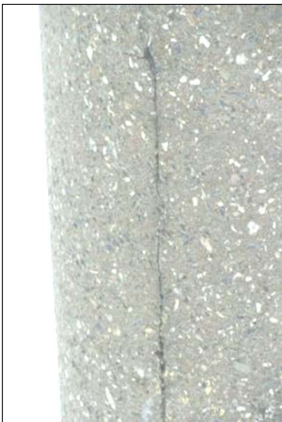
Фото 6. Опора № 12. Трещина длиной до 300мм, шириной более 1мм.