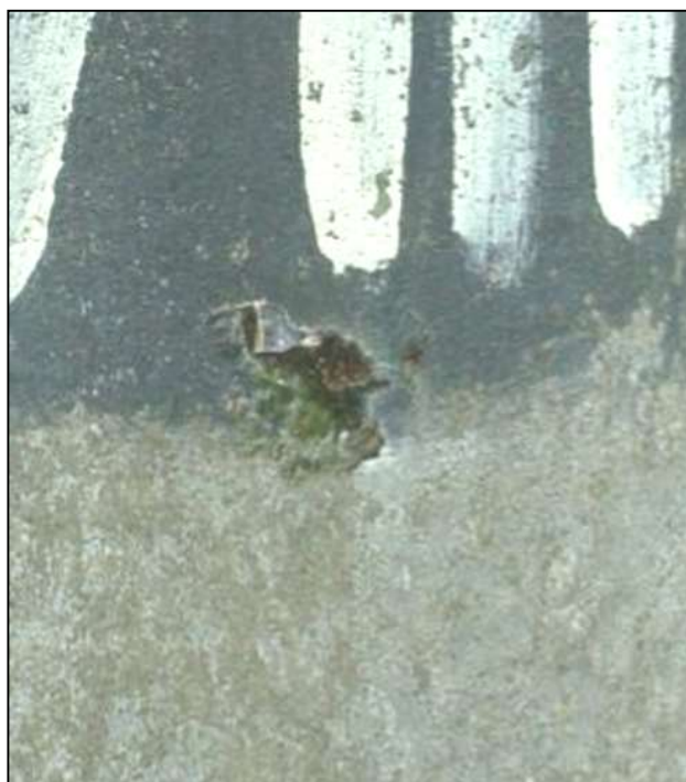
Фото 4. Опора № 19. Раковина в бетоне.