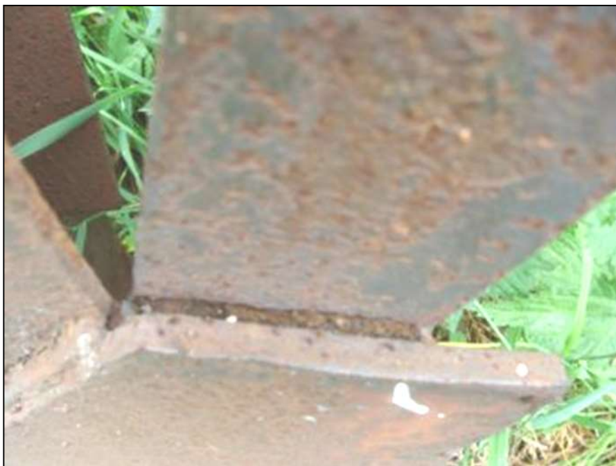
Фото 7. Опора № 18. Коррозия узлов и элементов.